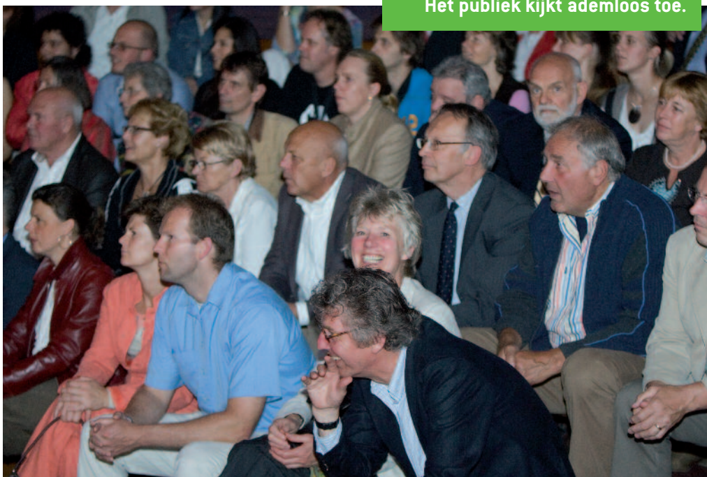
Het publiek kijkt ademloos toe.