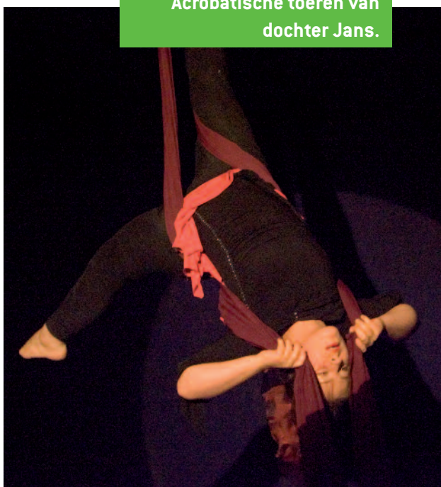
Acrobatische toeren van dochter Jans.