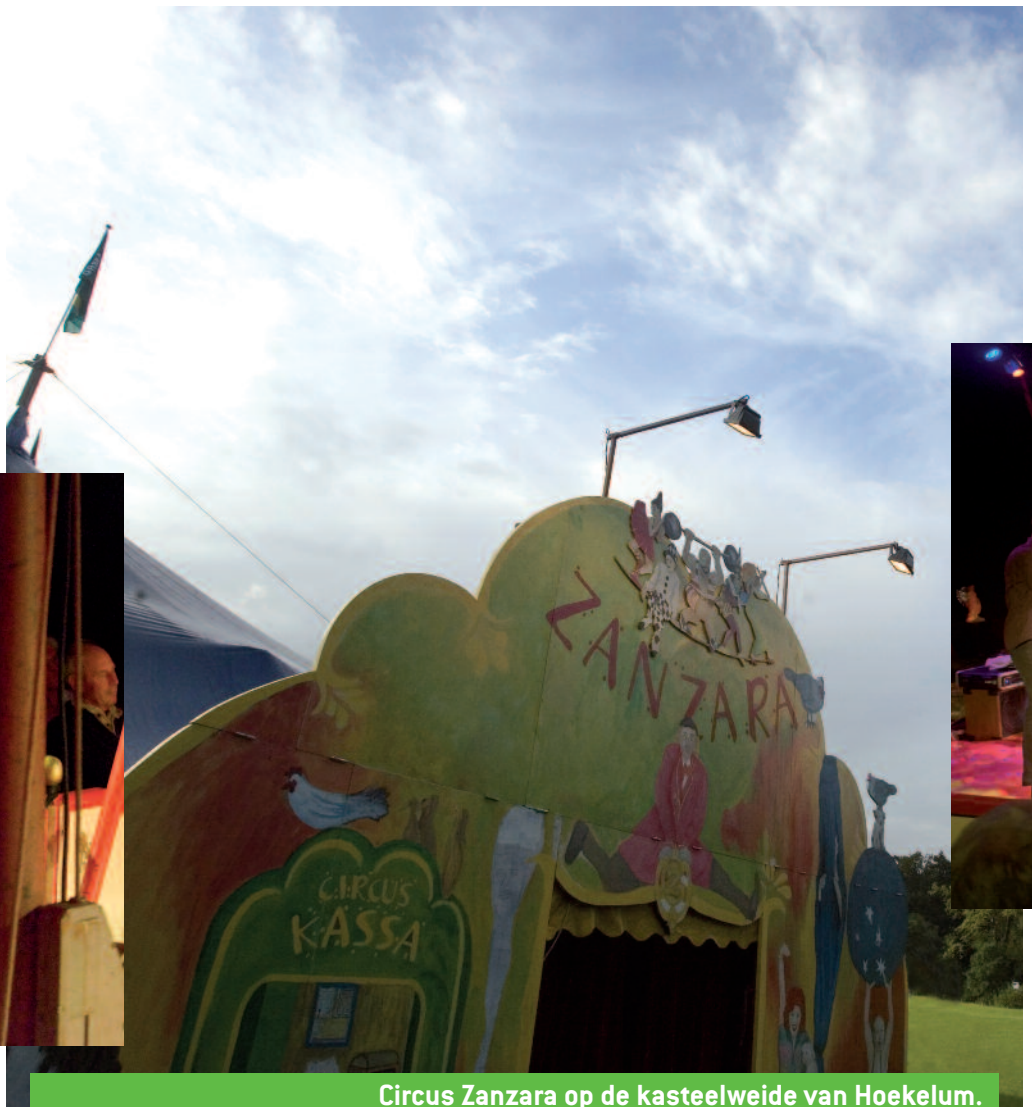
Circus Zanzara op de kasteelweide van Hoekelum.